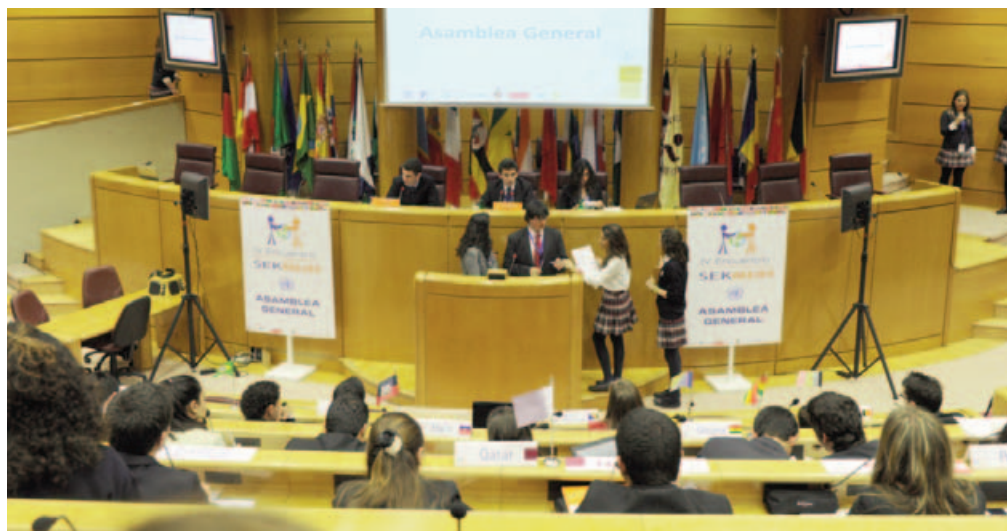
IV Encuentro SEKMUN. Asamblea General.